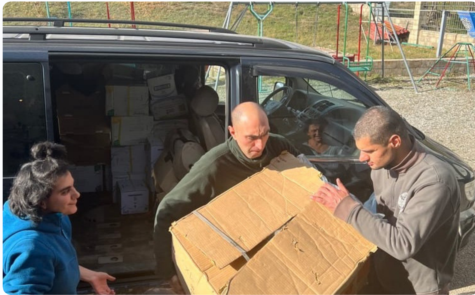
La population arménienne se mobilise

En quelques jours, c'est l'arrivée de plusieurs dizaines de milliers de réfugiés que l'Arménie doit gérer. Un défi humanitaire et logistique majeur.