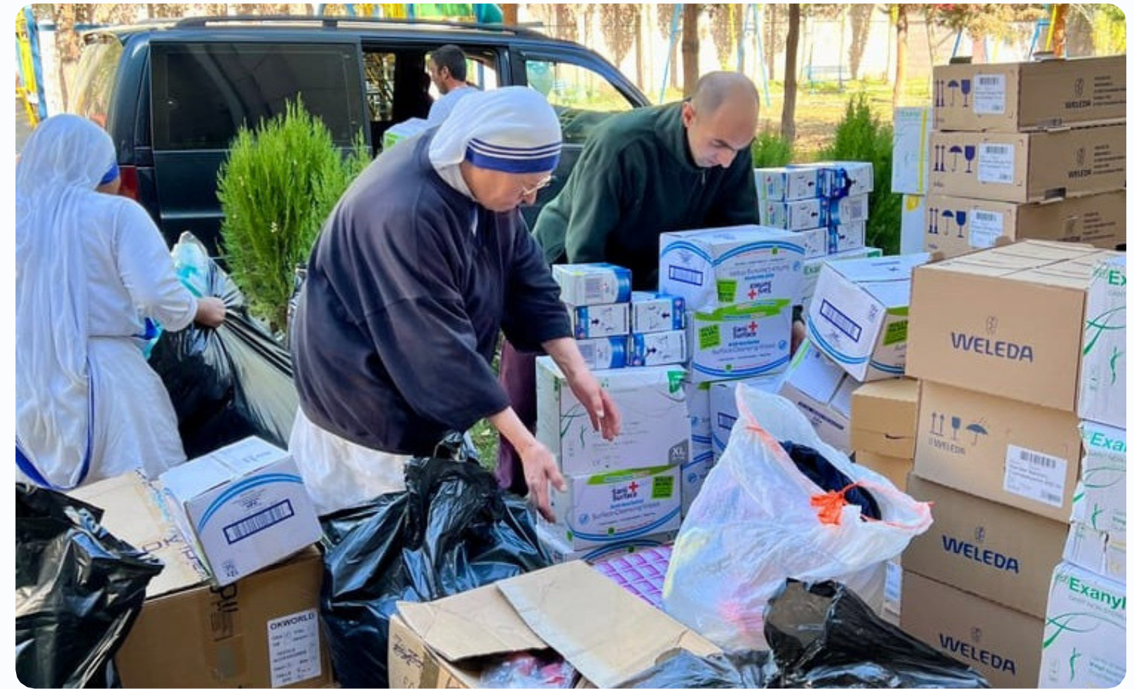
Action des soeurs de Mère Teresa

La paroisse Saint François a pu faire parvenir plus de 30 000 € d'aide humanitaire.